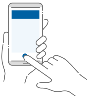
aplikacja na telefon