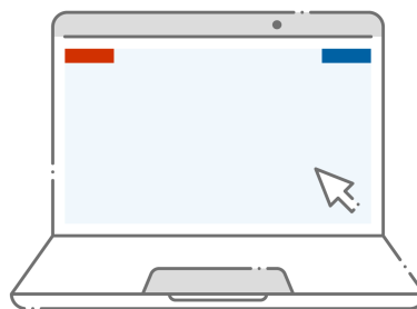
aplikacja desktopowa (komputer, tablet lub przez przeglądarkę w telefonie)